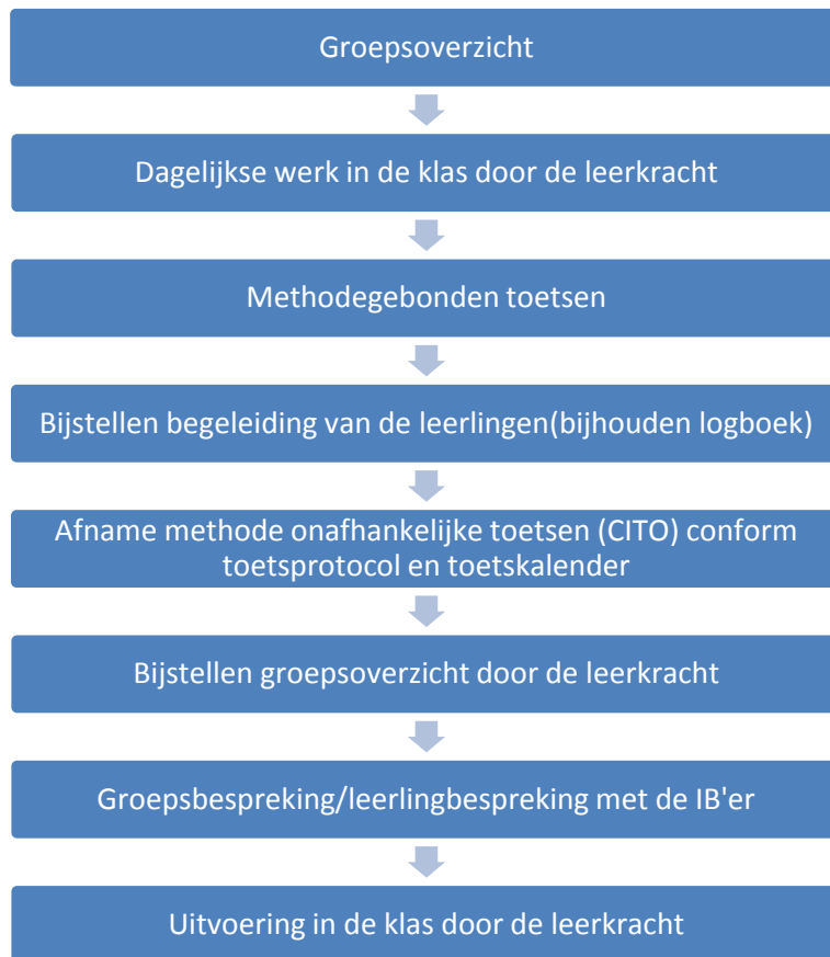
Figuur 2. Overzicht ondersteuningsstructuur

Indien extra interventies onvoldoende resultaat opleveren, dan kan overwogen worden om de leerling te laten doubleren of te versnellen. In sommige gevallen komen wij tot de conclusie dat we een leerling niet langer kunnen begeleiden. Op dat moment zullen wij een andere, beter passende plaats zoeken. Dat kan ook het speciaal (basis)onderwijs zijn. Ouders worden hier tijdig over geïnformeerd en bij betrokken.